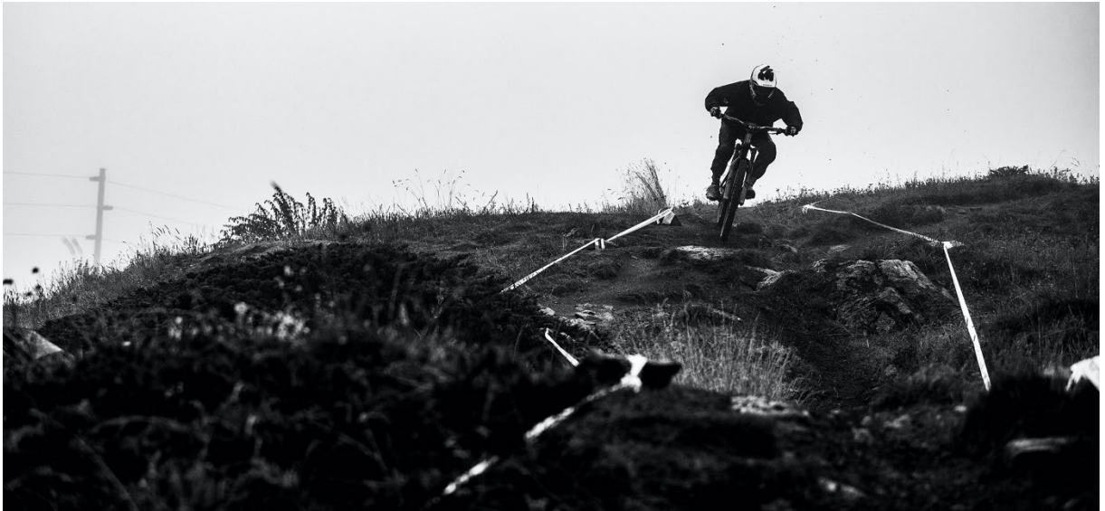
Tape auf beiden Seiten nahe am Boden windgeschützt

Wenn zwei Stücke Tape auf beiden Seiten des Trails angebracht sind, muss der Fahrer zwischen ihnen hindurchfahren. In diesen Bereichen wird das Überqueren oder das Umgehen des Tapes auf der anderen Seite als Abkürzung gewertet.